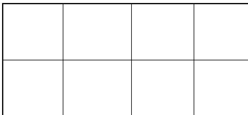
Рис. 1. Деление листа при формате в \frac{1}{8} долю (лист согнули 3 раза)

Знаменатель дроби представляет собой произведение двух чисел, показывающих, на сколько равных частей разделен лист по ширине и по длине для образования данной страницы и, следовательно, данного формата издания. Наиболее распространены следующие доли: \frac{1}{8} , \frac{1}{16} , \frac{1}{32} .