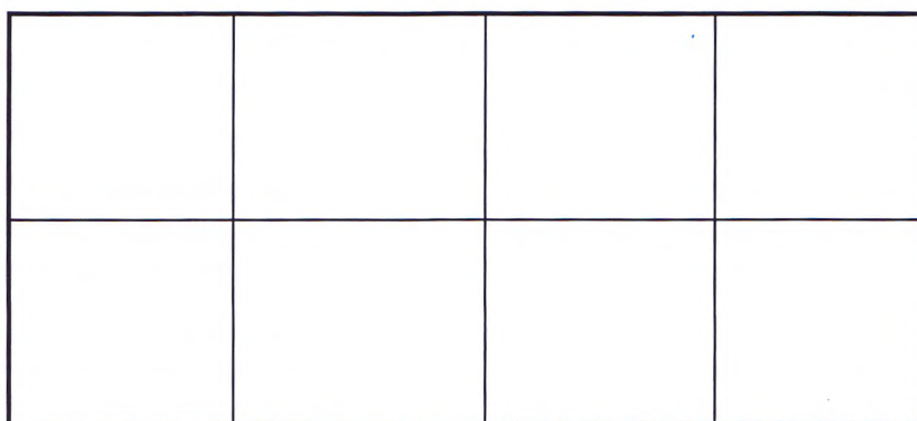
Рис. 1. Деление листа при формате в \frac{1}{8} долю (лист согнули 3 раза)

Знаменатель дроби представляет собой произведение двух чисел, показывающих, на сколько равных частей разделен лист по ширине и по длине для образования данной страницы и, следовательно, данного формата издания. Наиболее распространены следующие доли: \frac{1}{8} , \frac{1}{16} , \frac{1}{32} .